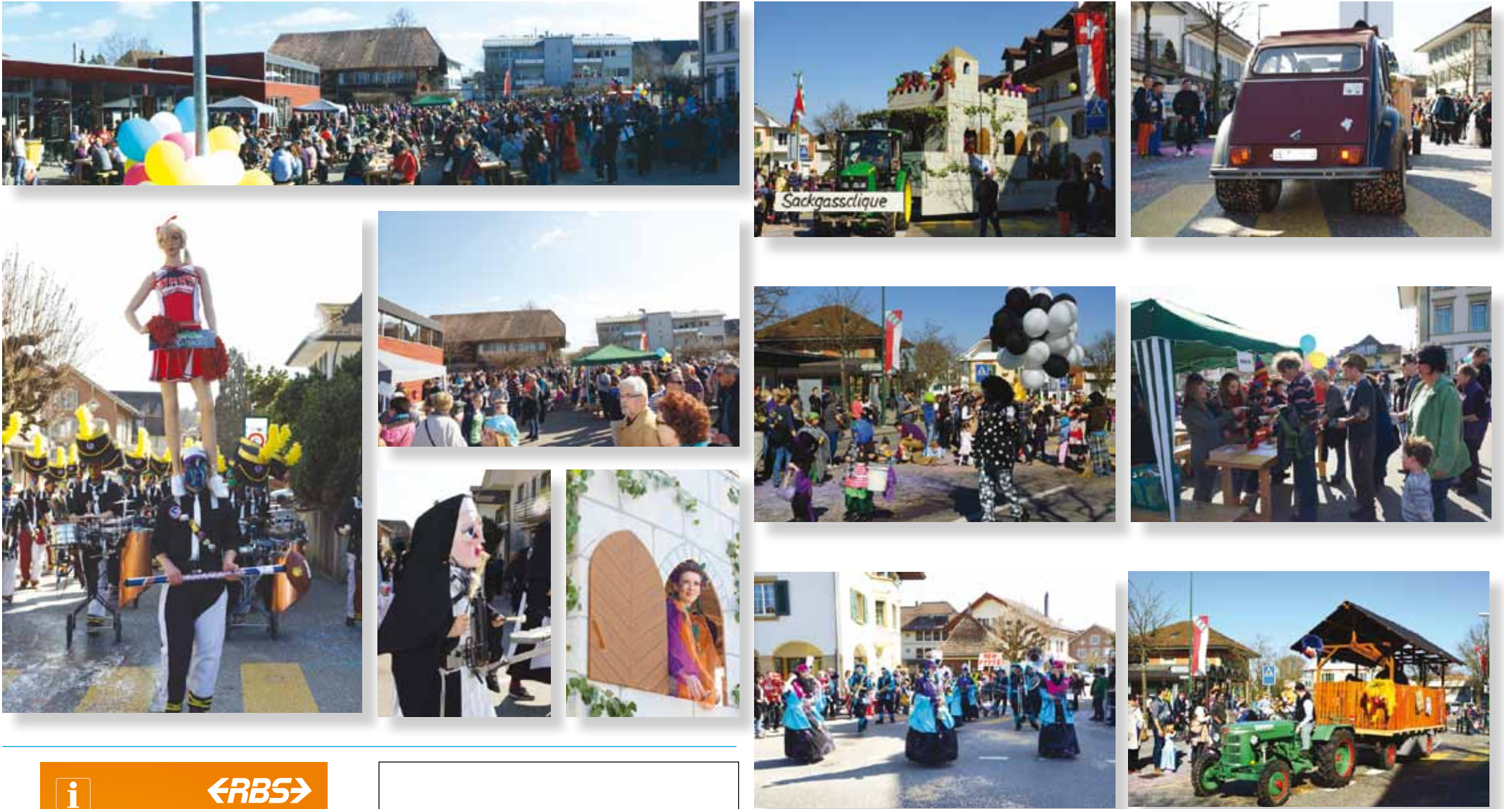
2014: ein Rekordaufmarsch an Publikum und Darbietungen, wir freuen uns darauf, diese Bestmarke 2015 wieder zu übertreffen. Seien Sie unser Gast, viele Überraschungen erwarten Sie!