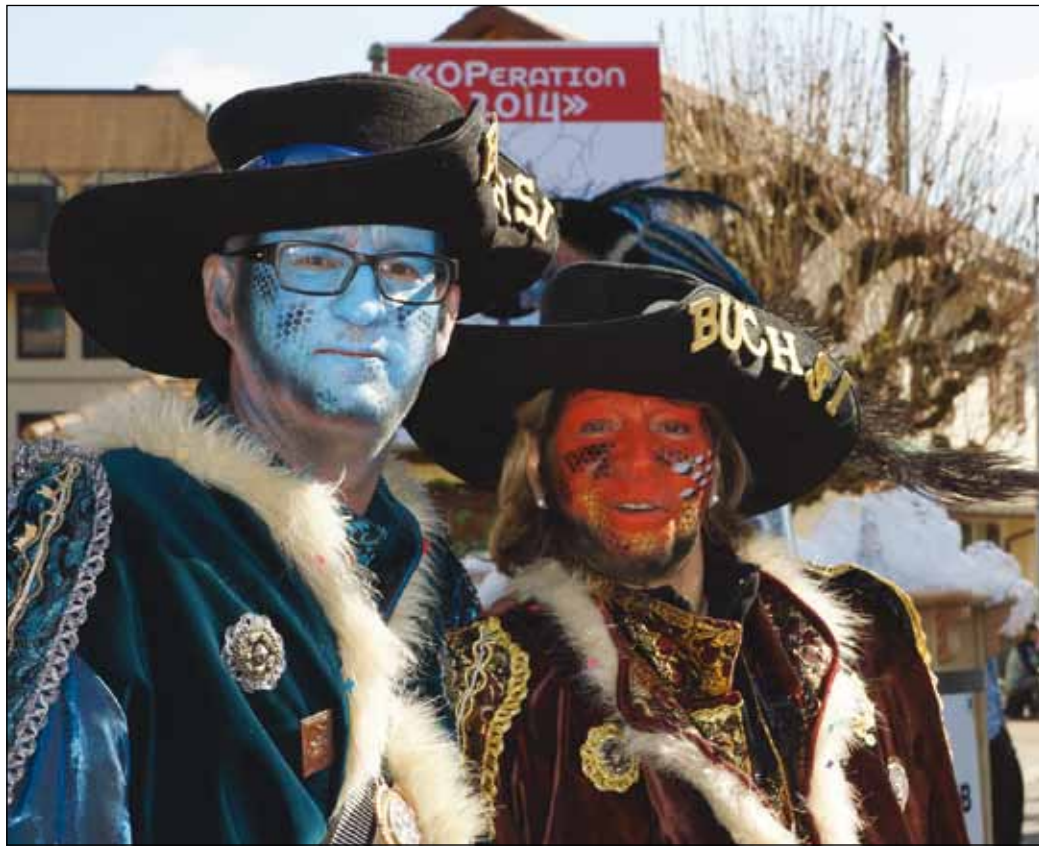
für 3 Tage wird Buchsi im Team registriert!

Liebe Fasnächtlerinnen Liebe Fasnächtler