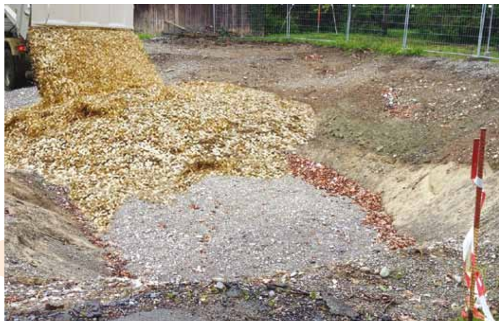
Basis: STEFAN BOHRER CC, bearbeitet durch U. Mosimann

Das Auffüllen hat begonnen. Vorne sehen wir die Budgetstange, die die angepeilte Höhe der Schwarzen Null angibt